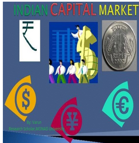
(Indian Capital Market factors)

Definitions and Meaning of Capital Market: The capital market is a place where people buy and sell securities. Securities in this sense is simply a bundle of rights sold to the public by companies, authorities or institutions on which people then trade in the capital market. There are different types of securities or bundles of rights. These include shares, debentures, bonds, etc. There are two levels of the market. The primary market is the market where those wishing to raise funds from the stock market sell their securities to the public. The secondary market is where those who bought the securities in the Initial Public Offer (IPO) can sell them any time they wish. The reason why people buy securities from the primary market is because they have the assurance that there is a secondary market where they can sell those shares possibly at a profit.